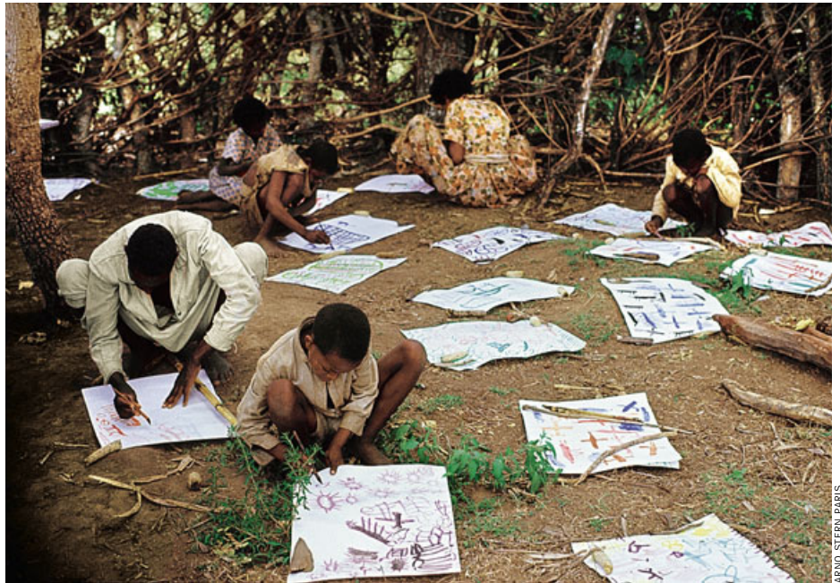
Stern-Aktion in Äthiopien (1972): „Eine schöne Blume – oder soll das die Sonne sein?“

Das sind die psychischen Nebenwirkungen des „Malspiels“, wie Stern es nennt – unabhängig vom Bildgegenstand. Doch Regelmäßigkeit, Vorhersehbarkeit fand er auch hier: Im Laufe der Jahre ging ihm auf, dass die ersten Malbewegungen aller Kinder entweder kreisende oder tupfende waren und dass aus diesen Bewegungen in