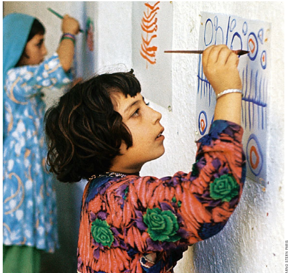
Stern-Projekt in Afghanistan (1969): „So scheint das Paradies zu sein“

Zugleich benötigten die Kinder heute ungleich mehr Zeit, sich auf das Malspiel einzulassen: „Sie sind ungleich mehr belas-