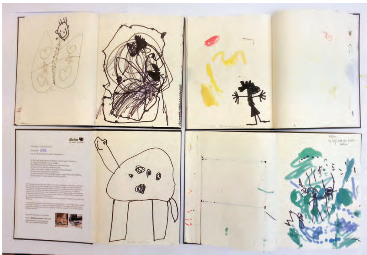
Groepsschetsboeken van 4 kleuterklassen van het Kris Kras Atelier project op de 14e Montessori school in Amsterdam

~ ZOON (4): PAPA, WIL JIJ HET DONKER UITDOEN? ~