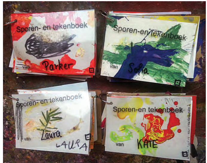
'4 Sporen- en tekenboekjes van jonge kinderen uit het Kris Kras Atelier van de Centrale Bibliotheek Amsterdam.'

De sporen- en tekenboekjes verschillen in nog een bijzonder opzicht van een gewoon schetsboek: pas nadat kinderen op losse A6-vellen gewerkt hebben, worden ze tot een boek gebundeld met een metaal sleutelring (met scharnier). Die kan open en dicht zodat altijd weer nieuwe tekeningen aan het boekje toegevoegd kunnen worden. Die werkwijze is essentieel om met jonge kinderen aan een eigen schetsboek te werken. Een kant-en-klaar schetsboek schept vaak hoge verwachtingen en is soms onhandig in het gebruik. Een kaartje is laagdrempeliger en leidt minder af dan een heel boek. Het werken met losse vellen maakt het mogelijk om met